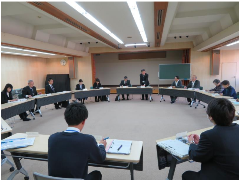
教育委員会・社会教育委員 合同会議の様子