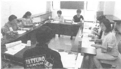
ピアノ講師会に使用料見直しについて意見を求めた

2017年(平成29年) 6月28日(水) 第22627号 [日刊] 昭和25年11月7日第